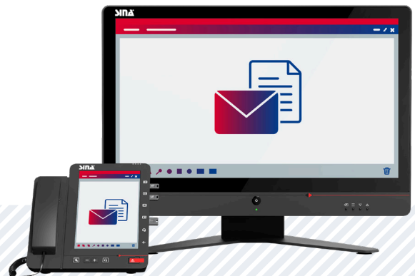
Thin-Client-Funktionalität zur Bearbeitung von Dokumenten und E-Mails per integriertem Touch-Display oder externem Monitor

Bereits heute kann man mit einer SINA Workstation über eine abgesicherte IPsec-Verbindung mittels VoIP kommunizieren, entweder in einem integrierten, dedizierten VoIP-Arbeitsplatz oder in einem Softclient, der in einer Virtuellen Maschine (VM) integriert ist. Mit dem SINA Communicator H ist es möglich, eine abwärtskompatible, IPsec-gesicherte Kommunikation zu den bisherigen SINA Workstation mit VoIP-Arbeitsplatz zu integrieren. Das erleichtert die Migration heutiger GEHEIM-fähiger VoIP-Sprachkommunikation zum SINA Communicator H und sichert damit die entsprechenden Investitionen ab.